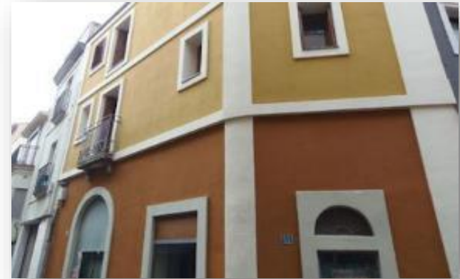
Vivienda rehabilitada Barcelona CERTIFICACIÓN A