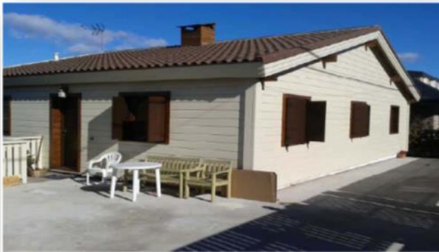
Vivienda construida por 100 x 100 madera Soto del Real, Madrid CERTIFICACIÓN A Oficina certificada Passivhaus